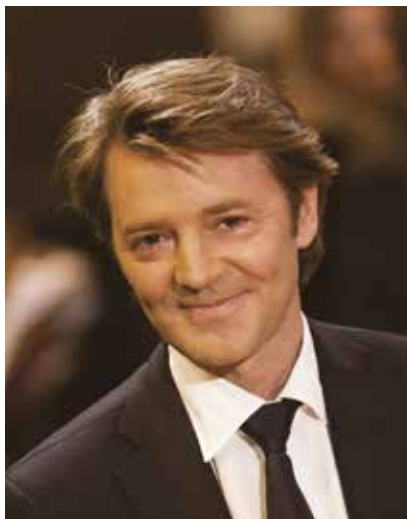
François BAROIN Président de l'AMF

Les communes et les intercommunalités sont engagées, comme le reste de la société, dans une profonde transformation numérique. En particulier, leurs échanges dématérialisés avec les citoyens, les acteurs économiques et les administrations publiques se sont multipliés. Dans le même temps, elles sont aussi devenues, ces derniers mois, des cibles d'attaques informatiques de plus en plus nombreuses.